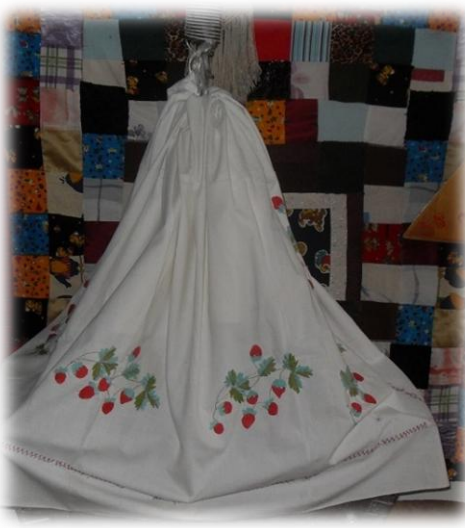
Наша зыбка скрип-скрип